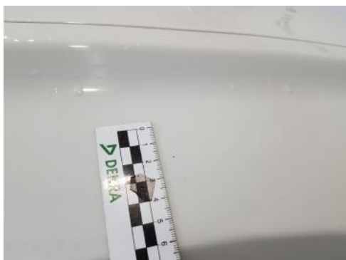
Fot. 33 Błotnik przedni prawy (Rysa/Odprysk 1)