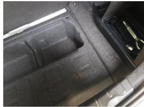
Fot. 18 Koło zapasowe/trójkąt/gaśnica