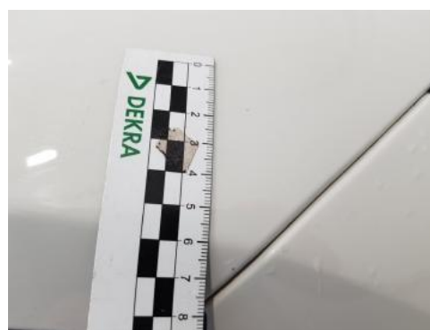
Fot. 32 Błotnik przedni prawy (Rysa/Odprysk)