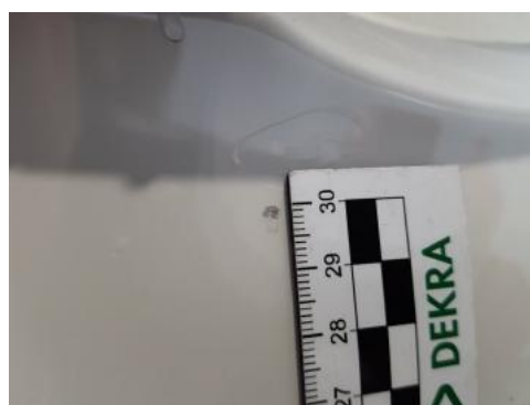
Fot. 36 Drzwi przednie prawe (Rysa/Odprysk)