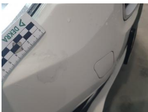
Fot. 27 Zderzak (Inne)