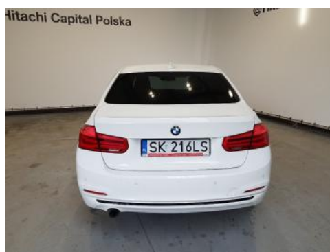
Fot. 4 Tył