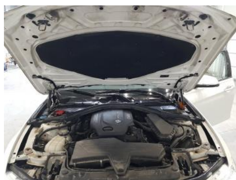
Fot. 16 Komora silnika