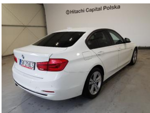
Fot. 3 Prawy bok tył