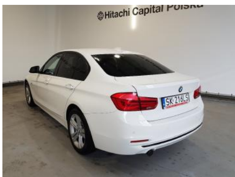
Fot. 5 Lewy bok tył