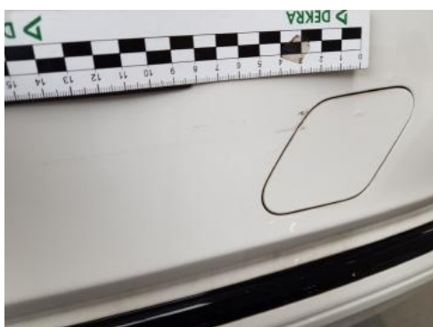
Fot. 43 Zderzak tylny (Rysa/Odprysk 2)