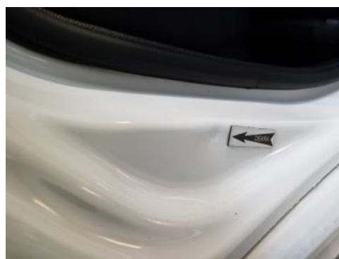
Fot. 38 Błotnik tylny prawy/ściana boczna prawa (Wgniecie./Odształ.)