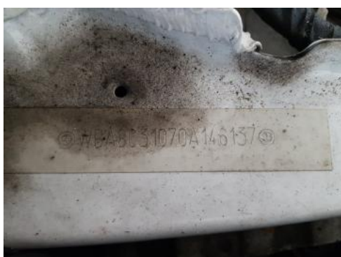
Fot. 7 Pole numerowe