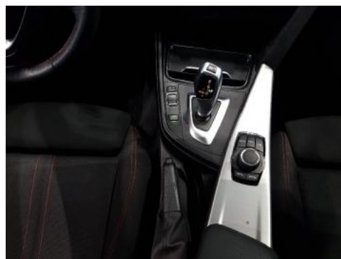
Fot. 14 Tunel środkowy