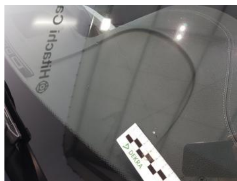
Fot. 30 Szyba czołowa (Zdjęcie pogładowe 1)