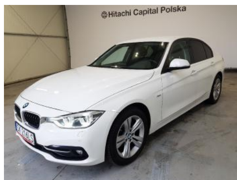
Fot. 6 Lewy bok przód