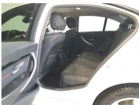
Fot. 11 Widok przez lewe tylne drzwi