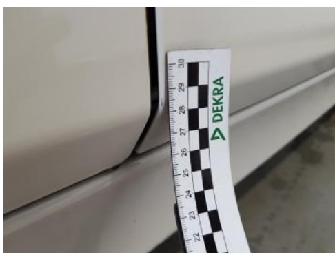
Fot. 37 Drzwi przednie prawe (Rysa/Odprysk 1)