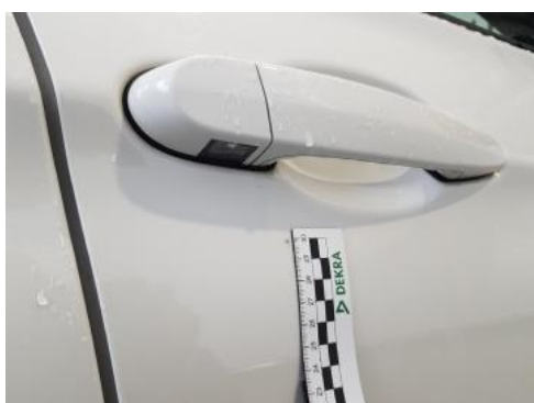
Fot. 35 Drzwi przednie prawe (Zdjęcie poglądowe 1)