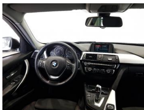
Fot. 12 Widok z tylnego siedzenia