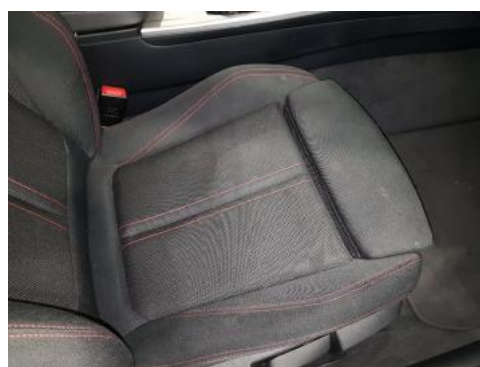
Fot. 48 Fotel prawy (Inne)