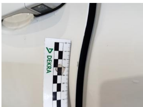
Fot. 45 Drzwi przednie lewe (Rysa/Odprysk)