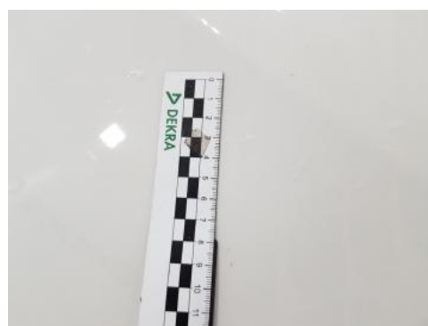
Fot. 28 Pokrywa komory silnika (Rysa/Odprysk)