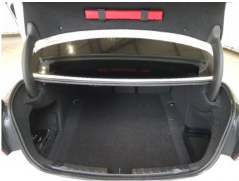
Fot. 17 Bagażnik