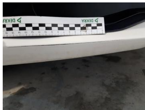
Fot. 26 Zderzak (Rysa/Odprysk 1)