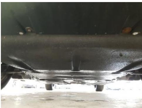
Fot. 19 Spód pojazdu przód