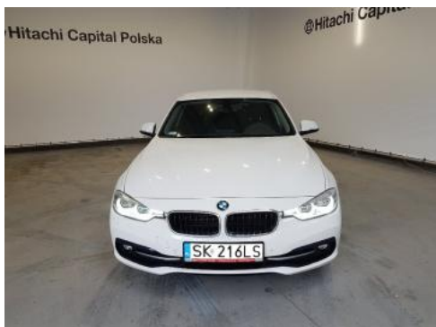
Fot. 1 Przód