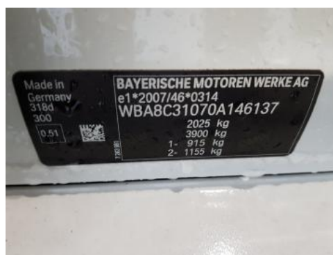
Fot. 8 Tabliczka