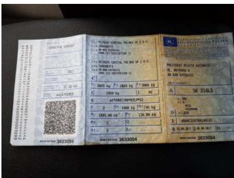
Fot. 21 Dowód rejestracyjny 1. strona