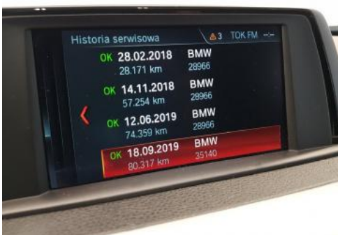
Fot. 23 Książka serwisowa - ostatni przegląd