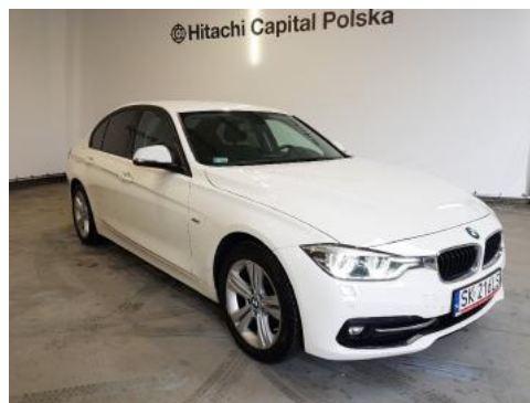
Fot. 2 Prawy bok przód