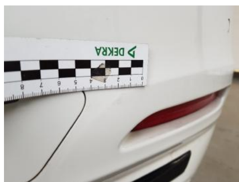
Fot. 40 Zderzak tylny (Zdjęcie poglądowe 1)