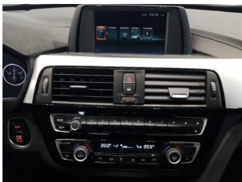
Fot. 13 Konsola środkowa