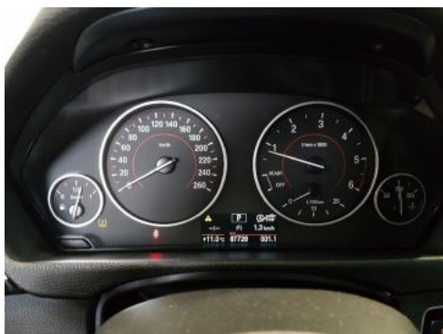
Fot. 9 Wskaźniki /przebieg/paliwo