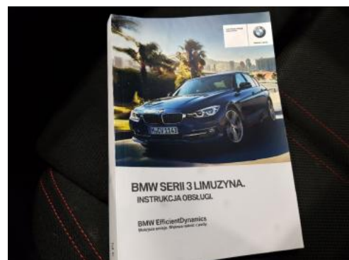
Fot. 24 Instrukcja obsługi