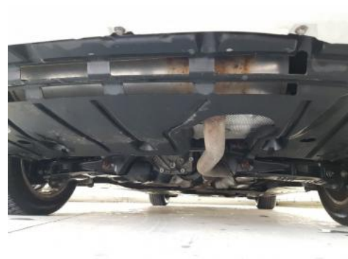
Fot. 20 Spód pojazdu tył