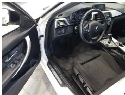
Fot. 10 Widok przez lewe przednie drzwi