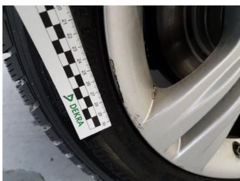
Fot. 39 Felga tylna prawa (Rysa/Odprysk)