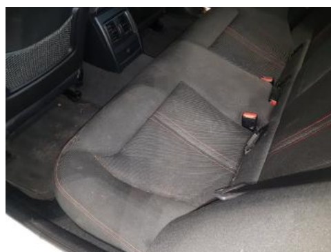
Fot. 46 Kanapa tylna (Inne)