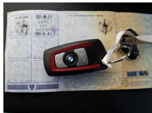
Fot. 22 Dowód rejestracyjny 2. strona / klucze