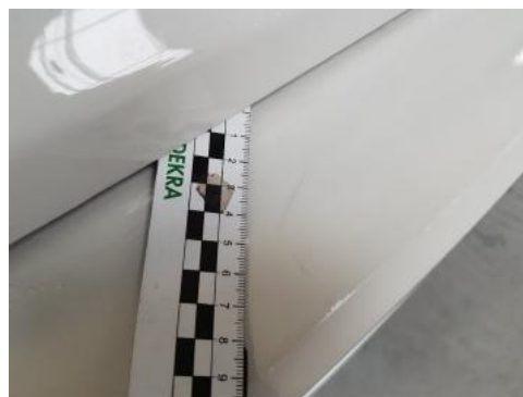
Fot. 42 Zderzak tylny (Rysa/Odprysk 1)