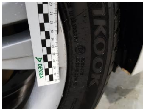
Fot. 34 Felga przednia prawa (Rysa/Odprysk)