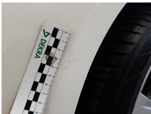
Fot. 25 Zderzak (Rysa/Odprysk)