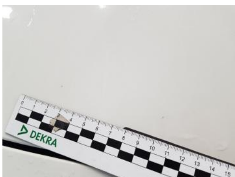
Fot. 29 Pokrywa komory silnika (Rysa/Odprysk 1)