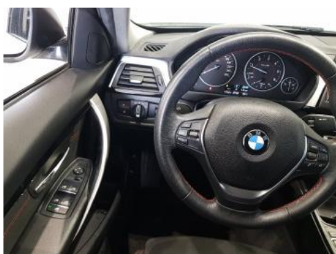
Fot. 15 Kierownica widok z lewej strony (widoczne przełączniki)