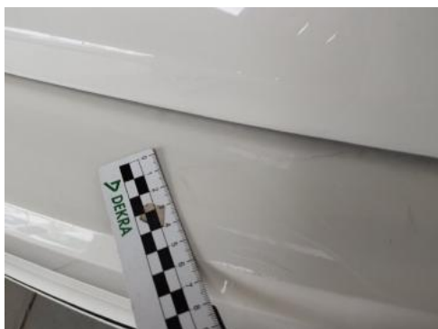
Fot. 41 Zderzak tylny (Rysa/Odprysk)