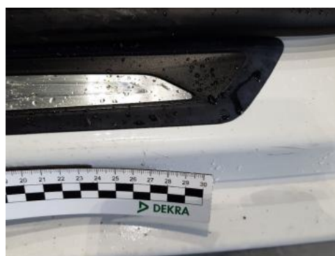
Fot. 44 Próg lewy (Rysa/Odprysk)